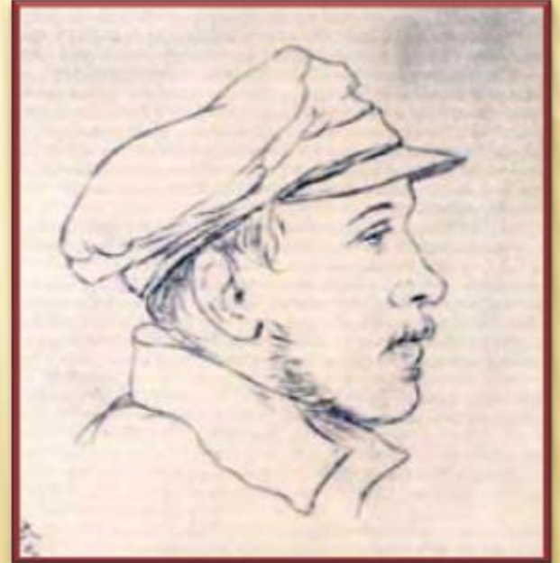
Портрет Лермонтова работы однополчанина Д.П. Палена (1840). ВЫПОЛНЕН ПОСЛЕ ВАЛЕРИКСКОГО БОЯ.

Летом 1840 Лермонтову пришлось стать участником военных действий на Кавказе. Он проявил исключительную храбрость в боях и был дважды представлен к награде, но все ходатайства об этом были отклонены. Добившись разрешения на короткий отпуск, Лермонтов в начале февраля 1841 г. приехал в Петербург, но преследуемый властями, вынужденный выслушивать унижительные выговоры, опальный поэт с величайшим трудом получил возможность провести в Петербурге около трёх месяцев.