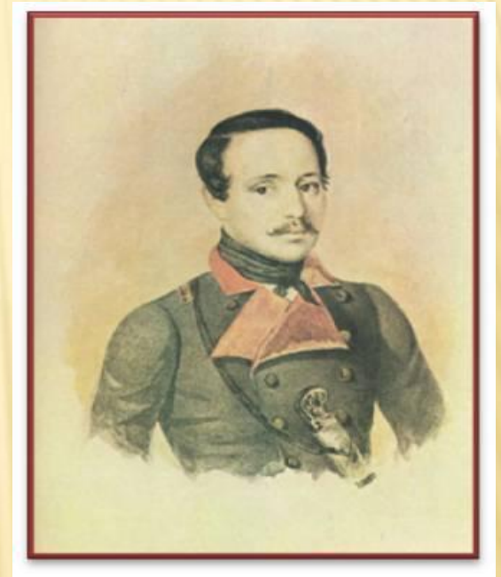
ПОРТРЕТ ЛЕРМОНТОВА РАБОТЫ К.А. ГОРБУНОВА. 1841 Г.

По пути в полк Лермонтов задержался в Пятигорске для лечения. Здесь и произошла ссора Лермонтова с Мартыновым, закончившаяся роковой дуэлью.